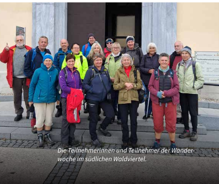
Die Teilnehmerinnen und Teilnehmer der Wanderwoche im südlichen Waldviertel.

Im Gasthof Forellenhof endete unsere Wanderwoche in einer gemütlichen Runde mit dem Ergebnis, 2.524 Höhenmeter geschafft zu haben, eine wirklich tolle Leistung. Die dritte Wanderwoche im Yspertal mit wieder neuen Routen ist für die 21. Kalenderwoche vom 18. bis 22. Mai 2026 geplant. Die genaue Ausschreibung erfolgt mit Februar 2026. ■